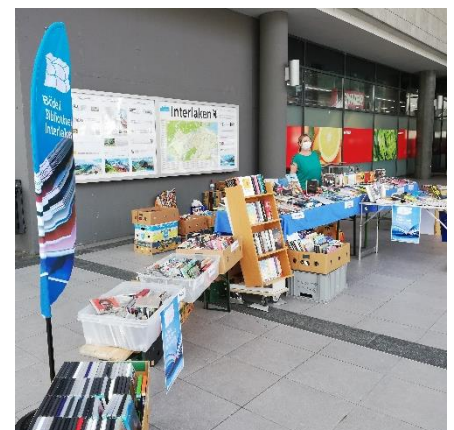
Flohmarkt vor dem Migros

Möchten Sie auf dem Laufenden bleiben über unsere neusten Ausstellungen, Themen und Veranstaltungen? Besuchen Sie unsere Website ( www.boedeli-bibliothek.ch ) oder folgen Sie uns auf Facebook oder Instagram!