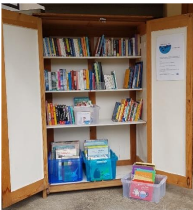
Badi Bibliothek von Mai – September