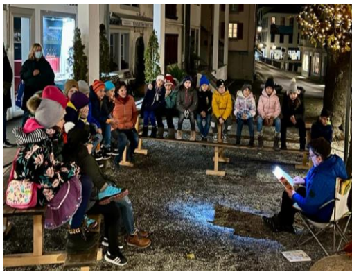
Mit Geschichten, Wettbewerb, Basteln und in Büchern stöbern konnte die Erzählnacht trotz Corona mit 20 Kindern stattfinden.