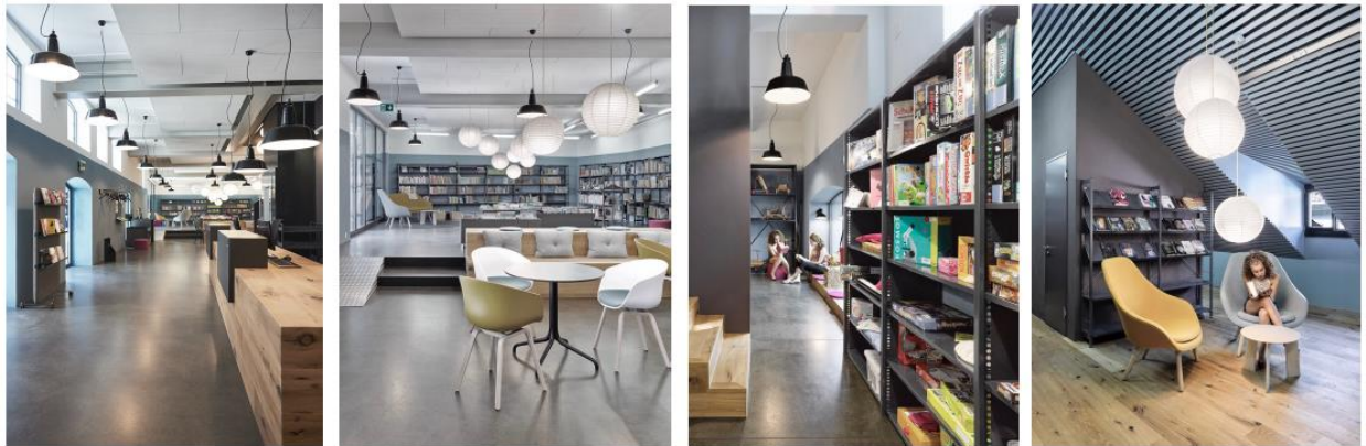
Innenarchitektur & Bibliotheksplanung: Atelier Michelle Bühler - www.michellebuehler.ch

Ein Teil des Innenausbau (Bodenbeläge, Malarbeiten Wände, WC, Küche, Teile der Elektro-Ausstattung) erfolgt zu Lasten der Eigentümerin. Für die Finanzierung von Planung, Einrichtung und Umzug erhalten wir von den drei Standortgemeinden Interlaken, Matten und Unterseen finanzielle Unterstützung in Form eines einmaligen Investitionsbeitrages von CHF 190'000.-. Die restlichen Kosten sollen durch den Verein Bödéli Bibliothek Interlaken und mit Sponsorengeldern von Firmen und Privatpersonen gedeckt werden.